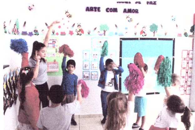
Oficina de inglês