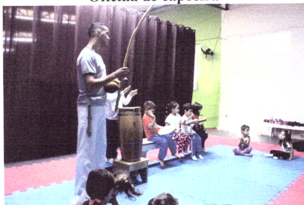
Oficina de artes