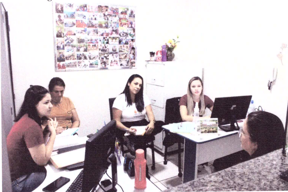
Entrega da lembrancinha de Páscoa.