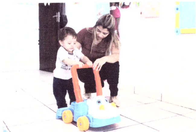
Psicóloga e Educadora Parental/Atendimento multidisciplinar