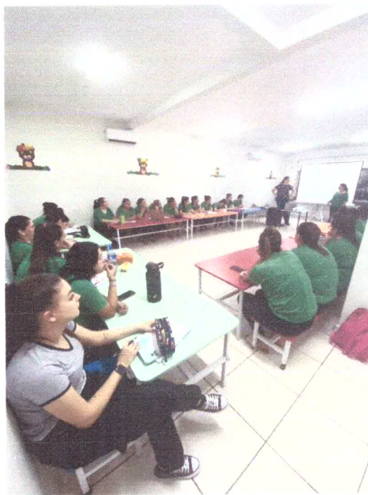
Capacitação em Desenvolvimento da fala