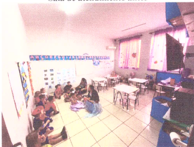
Sala de atendimento antes