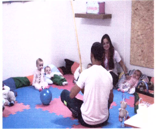
Jogo simbólico transitivo