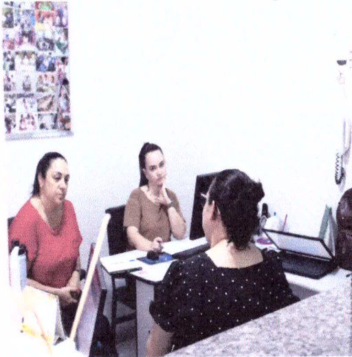
Capacitação de equipe